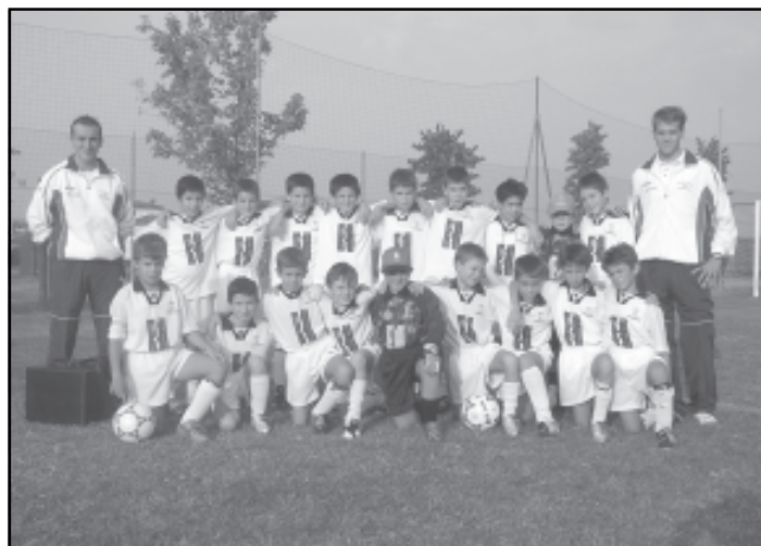
Debuttanti a11 CSI - '94