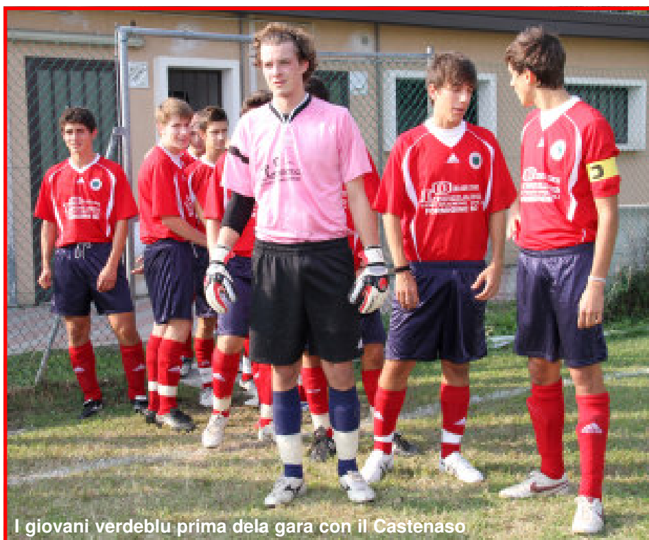
I giovani verdeblu prima della gara con il Castenaso

Vittoria importante per il Formigine che, nonostante la gara non brillante, porta a casa l'intera posta e rimane nella zona di alta classifica. (Giorgio Sghedoni)